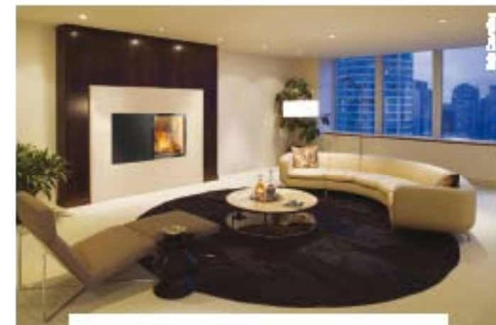
MARS VERSION „X“